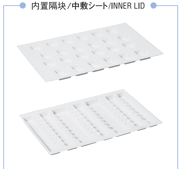
● 内置隔块/中敷シート/INNER LID